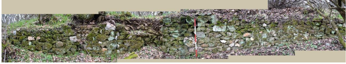
Εικ. 5. Παλαιόκαστρο Λαχανά. Η τοιχοδομία της α΄ φάσης. Τμήμα από την ανατολική πλευρά της οχύρωσης.