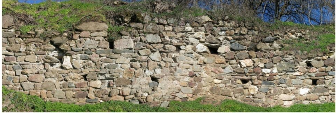
Εικ. 6. Παλαιόκαστρο Λαχανά. Η β΄ φάση της οχύρωσης. Τμήμα της νοτιοδυτικής πλευράς.