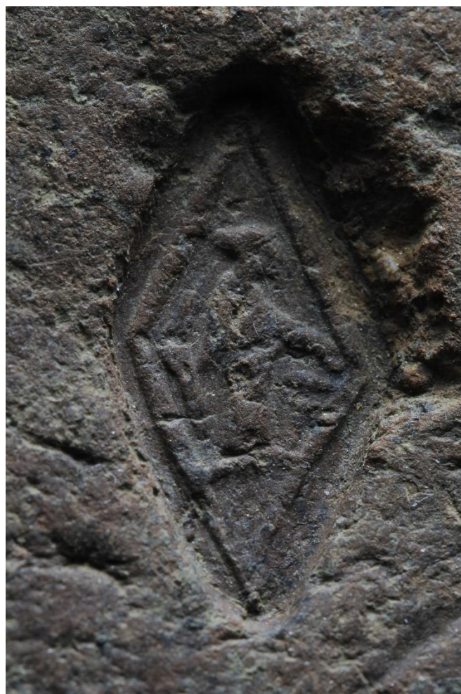
Εικ. 2. Παλαιόκαστρο Λαχανά. Η παράσταση στην ρομβοειδή σφραγίδα της αγνύθας.