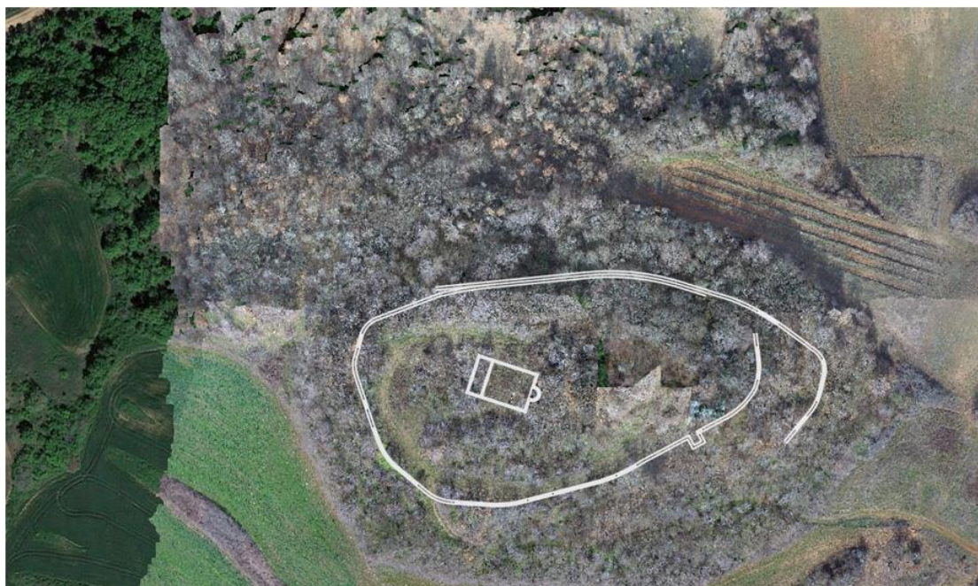
Εικ. 3. Παλαιόκαστρο Λαχανά. Προβολή της κάτοψης στο φωτομωσαϊκό του λόφου.