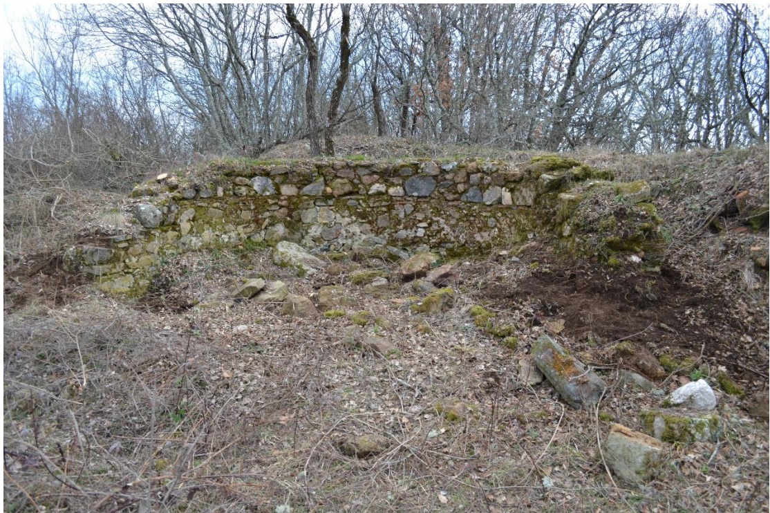
Εικ. 7. Παλαιόκαστρο Λαχανά. Η κεντρική κόγχη του βήματος του ναού στο κέντρο της οχύρωσης.